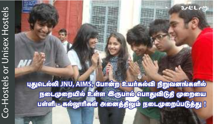
Co-Hostels or Unisex Hostels

இளம்வயதுப் பெண்களோ, தன்னை அழகு படுத்துவது தனக்குப் பிடித்திருக்கிறது. மேலும் இது தங்களை மெருகூட்டுவதாகவும், “அலங்காரம் இல்லாமல் வாழ்வது ஒரு வாழ்க்கையா? இதில் எவ்வளவு ஸ்டைல் இருக்கு தெரியுமா? ஒவ்வொரு ஃபங்ஷனுக்கும் தனித்தனியாக ட்ரஸ் கோட் இருக்கு” என்று மிக ஏக்கத்துடன் கூறகிறார்கள்.