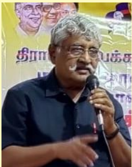
பொதுச் செயலாளர் உரை நிகழ்த்துகிறார்