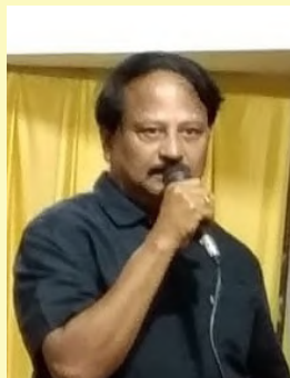
துணைப் பொதுச் செயலாளர் ஆ.சிங்கராயர்