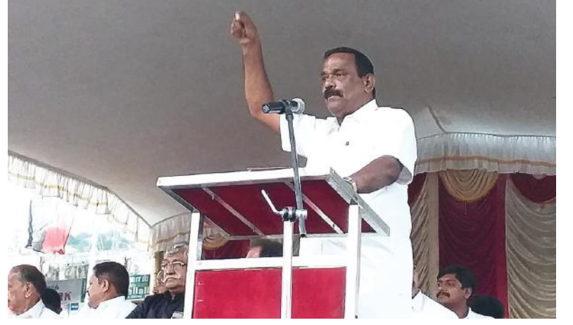
கோத்தகிரி : பொள்ளாச்சி மா.உமாபதி