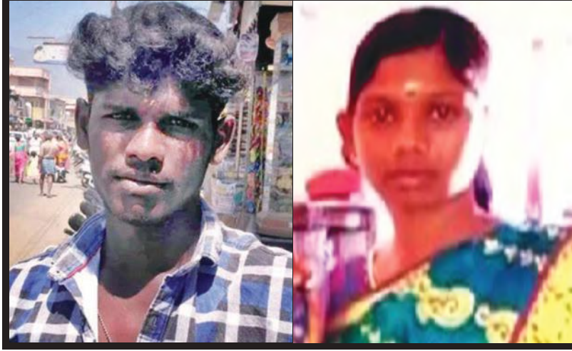
சாதியத்தால் கொல்லப்பட்ட காதலர்கள்