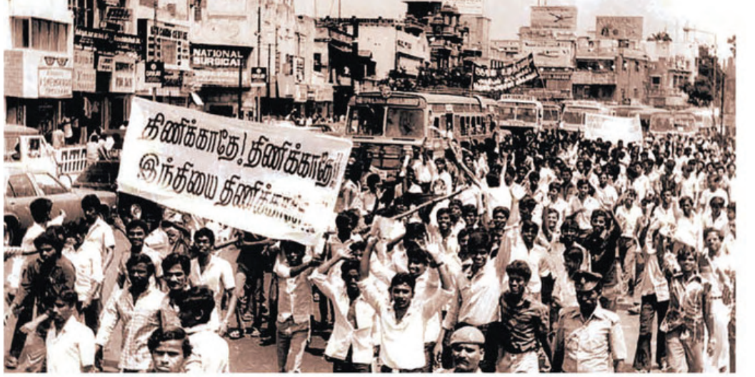
1965-ம் ஆண்டு இந்தி மொழிக்கு எதிராக மாணவர்கள், இளைஞர்கள் போராட்டம் நடத்திய காட்சி.

இந்தியைத் தாய்மொழியாகக் கொண்டவன், படித்துப் பட்டம் பெற்று, வடக்கே வேலை கிடைக்காமல் தெற்கு நோக்கிப் படையெடுக்கிறான், சென்னைக்கும், பெங்களூருக்கும், ஐதராபாத்துக்கும், திருவனந்தபுரத்திற்கும் தினந்தோறும் வடக்கே இருந்து வரும் தொடர்வண்டிகளில் எல்லாம் ஆயிரக்கணக்கான வடநாட்டு இளைஞர்கள் வேலை தேடி வந்துகொண்டு இருக்கின்றனர். ஆனால், இவர்கள் இந்தியைப் படித்தால் வடநாட்டில் வேலை கிடைக்கும் என்கின்றனர். இங்கே வந்தவர்களுக்குப் படிப்புக்கேற்ற வேலை கிடைக்கவில்லை என்பதால், சப்பாத்திக்கடை போடுகிறான்,