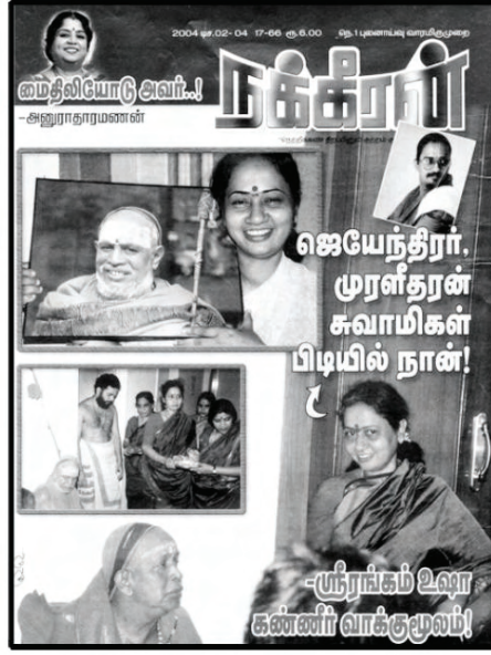
நக்கீரன் 2004 டிச. 02

ஆனால் பல ஆண்டுகளுக்குப் பின் இதனை வெளியிடுவது ஏன் என்ற வினா என் போன்றவர்களிடமும் எழுந்தது. பெண்ணின் வலியையும், துயரத்தையும் எத்தனை ஆண்டுகளுக்குப் பின் வெளியிட்டால் என்ன என்று தோழர்கள் சிலர் தங்களின் குரலைப் பதிவு செய்தபோது, அதன்