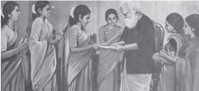
1938 -இல் சென்னையில் நடைபெற்ற பெண்கள் மாநாட்டில், தீர்மானம் நிறைவேற்றி அய்யாவுக்கு! அளிக்கப்பட்ட பட்டம் தான் "பெரியார்".

பெண்கள் உரிமைக்காக ஆண்கள் போராட வரமாட்டார்கள் என்பது பெரியாரின் உறுதியான கருத்து அந்த மாநாட்டைப் பெண்களே முழுமையாக முன்னின்று நடத்தினர் 16 வயது வரை பெண்களுக்கு கட்டாயக் கல்வி தர வேண்டும், பால்ய விவாகத் தடுப்புச் சட்டத்தைத் தீவிரமாகவும் உடனடியாகவும் அமல்படுத்த வேண்டும். பெண்களைக் கோயிலுக்குப் பொட்டுக் கட்டி விட்டு விபச்சாரிகளாக்கும் இழிவுக்கு முற்றுப்புள்ளி வைக்க வேண்டும் என்ற தீர்மானங்கள் அதிலே நிறைவேற்றப்பட்டன. (குடி அரசு 1930 மே 18) பொதுமாநாட்டில் குறுக்கிடாமல் - இந்தப் பெண்கள் மாநாடு தனியாகவே நடத்தப்பட்டது. இளைஞர்கள் மாநாட்டிலும்