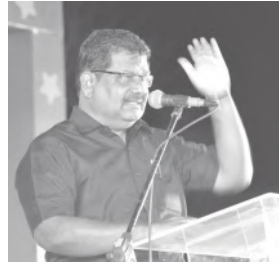
இப்போதிருக்கிற பரீட்சை முறை மாணவரின் அறிவை சோதிப்பதாக இல்லை, அவர்களுடைய ரூபக சக்தியை சோதிப்பதாக இருக்கிறது என்றார் பெரியார்

தற்போது எல்லாமே தலைகீழாக நடக்கிறது. நாம் ஒரு காலத்தில் சமஸ்கிருதம் படிக்க வேண்டும் என்று கேட்டோம்; சமஸ்கிருதம் படிக்கக் கூடாது என்றார்கள். வேதங்களில் என்ன இருக்கிறதென்று அறிந்து கொள்ளப் படிக்கிறோம் என்று கேட்டோம். நம்மைப் போன்றவர்கள் இல்லை! டாக்டர் அம்பேத்கர் போன்ற அறிவாளிகள், உலகின் மிகச் சிறந்த அறிவாளியாகக் கருதப்பட்ட அம்பேத்கர் போன்றவர்களெல்லாம் இந்த நாட்டு சாஸ்திரங்களை ஆய்வு செய்ய வேண்டும், புராணங்களைப் படிக்க வேண்டும், ஜாதி உருவாக்கத்தைப் புரிந்து கொள்ள முயற்சித்துக் கேட்ட பொழுது சமஸ்கிருதத்தை கற்றுக் கொடுக்க மறுத்து விட்டார்கள். சின்ன ஜாதிக்காரர்கள் சமஸ்கிருதம் படிக்கக் கூடாது என்று மறுத்துவிட்டார்கள். பார்சி மற்றும் ஆங்கில மொழிகளில் மொழிபெயர்க்கப்பட்ட வேதங்களையும், புராணங்களையும் படித்துத்தான் அம்பேத்கர்