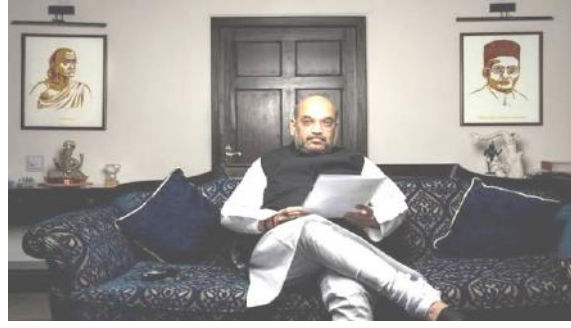
பார்த்தவர் சாவர்க்கர்' என்று சில ஆய்வாளர்கள் சொல்வது, அதனாலேயே!

பின்னாளில், இஸ்ரேலும் அவரது மனதைக் கவர்ந்ததற்குக் காரணம் அதுவே. இந்தியாவை காலனியாதிக்கத்தின் கண்கள் கொண்டு