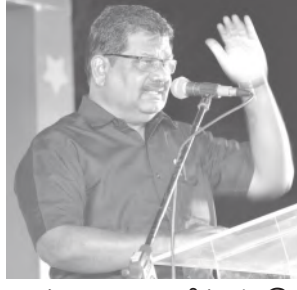
அவ்வளவு துணிச்சல் இருக்கிறது, எதை வேண்டுமானாலும் சொல்லலாம் என்று அவர்கள் நம்புகிறார்கள். ஆனால், அவர்கள் பாட நூல்களில் மாற்றங்களை செய்து கொண்டே இருக்கிறார்கள்.

அப்பொழுது தான், அதன் காரணமாகத் தான் பெரியாருடைய ‘புரட்சி’ பத்திரிக்கை நிறுத்தப்பட்டு விட்டது. அதை பெரியார் பின்னால் எழுதுகிறார். நான் இஸ்லாம் பற்றி பேசினேன். என் குடியரசு பத்திரிக்கையைத் தடை செய்தார்கள்; கிருஸ்துவ மதத்தைப் பற்றிப் பேச ஆரம்பித்தவுடன் என்னுடைய ‘புரட்சி’ பத்திரிக்கை நிறுத்தப் பட்டு விட்டது. இந்து மதத்தினரிடம் அன்றாடம் நான் தொல்லைப்பட்டுக் கொண்டிருக்கிறேன், என்று அவர் எழுதுவார். அந்த நாடு, ஏற்றத் தாழ்வு இல்லாத நாடு. ஆனால் நம் நாட்டில் இருக்கிற இந்த குடிமைச் சமூகத்தையோ அதை மாற்றுவதற்கான முயற்சியிலேயோ, ஆனால் எதிர் புரட்சியாளர்களாக இருக்கிற, மாற்றத்தை விரும்பாதவர்கள் அதை செய்துக் கொண்டிருக்கிறார்கள், கல்வியில் புகுத்துகிறார்கள். ஏற்கனவே காந்தி இறந்து போனார் என்று எழுதுகிறார்கள். ஒரு ஐந்து ஆண்டுகளுக்கு முன்னால், குஜராத் வரலாற்று பாட புத்தகங்களில், 30.01.1948ல் காந்தி ‘இறந்து’ போனார் என்று எழுதினார்கள். அப்போதே நான் ஒரு நிகழ்ச்சியில் பேசும்போது, இன்னும் கொஞ்ச நாட்களில் காந்தி தற்கொலை செய்து கொண்டார் என்றும் சொல்லப்