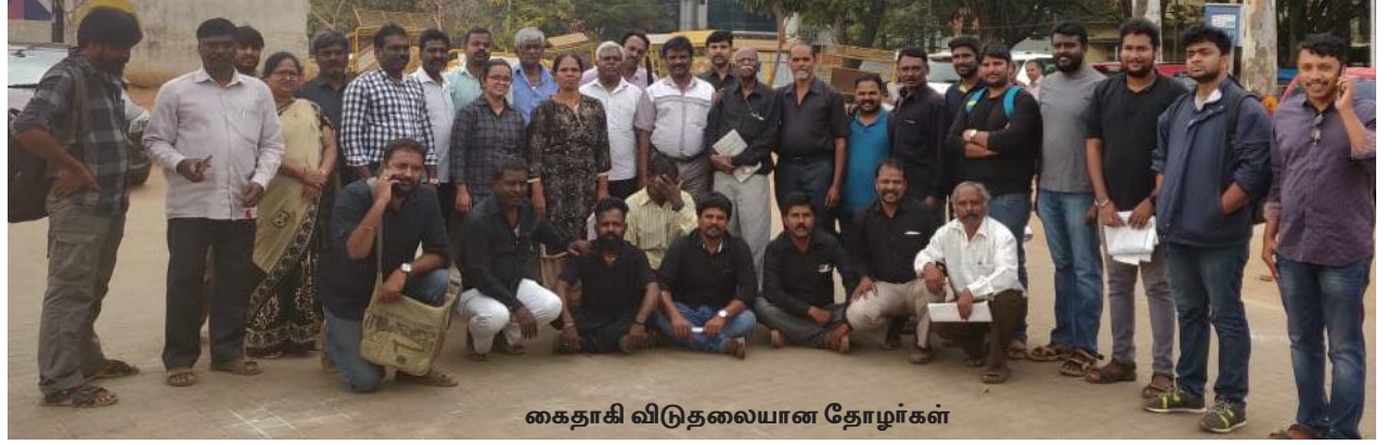
கைதாகி விடுதலையான தோழர்கள்

9-02-2019 காலை 10 மணி அளவில் 'இந்திய இலங்கை வெளியுறவு கொள்கையின் எதிர்காலம்' என்ற தலைப்பிலான இந்துக் குழும நிகழ்வில் கலந்து கொள்ள பெங்களூருக்கு வந்த இனப்படுகொலையாளி மகிந்த ராஜபக்சேவை கண்டித்து ஆர்ப்பாட்டம் பெங்களூர் பீர்டம் பார்க் அருகில் நடந்தது.