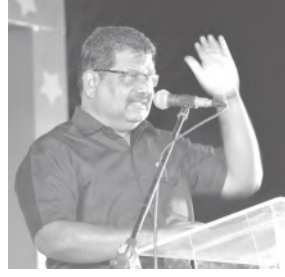
தேசியக் கல்விக் கொள்கையின் நோக்க உரையே பார்ப்பனிய மனுசாஸ்திரத்தை வெளிப்படுத்தி இருக்கிறது

குழலை உருவாக்கித் தரும் நோக்கத்தோடு சமூகநீதிக்கான கல்விக் கொள்கையை நாம் உருவாக்கி வைத்துள்ளோம். அதை முழுமையாக சிதைத்து, வெகு மக்களுக்கு கல்வி சென்றடைந்து விடக்கூடாது என்ற உள்நோக்கத்தோடு தடைகளை எழுப்பும் இந்த புதிய, தேசியக் கல்விக் கொள்கையை அமுல்படுத்த நடுவண் அரசு துடிக்கிறது.