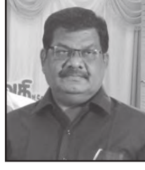
1996 ஆம் ஆண்டு தேர்தலின் போதே பாரதிய ஜனதா கட்சியின் தேசியக் குழு போபாலில் கூடியது, அதில் குடியரிமைப் பதிவேட்டை வலியுறுத்தி தீர்மானங்கள் போடப்பட்டன. அதை தேர்தல் அறிக்கையாகவே கொடுத்தார்கள்.

எல்லோரும் ஆதாரம் கொடுத்தாக வேண்டும் என்பது தான் சட்டம். D என்று எழுதிய அதிகாரி யிடம் சான்றிதழ் கொடுக்க வேண்டும். அவர் சரி பார்த்து 90 நாட்கள் அல்லது தேவையேற்பட்டால் இன்னும் அதிக காலம் எடுத்துக் கொண்டு அவர் அதை பரிசீலித்து உங்களை ஏற்றுக் கொள்ளலாம் அல்லது நிராகரிக்கலாம். ஏற்றுக்கொண்டால் பட்டியலை வெளியிட வேண்டும். அந்த பட்டியலில் உள்ளவர்களை யார் வேண்டுமானால் ஆட்சேபிக்கலாம். அப்படி மற்றொருவர் நமது சான்றிதழ்கள் தவறு என்று கூறிவிட்டால் நாம் மீண்டும் மேல் முறையீட்டிற்கு செல்ல வேண்டும். அவரிடம்