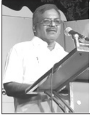
தமிழர்களை அழிக்கும் நச்சுத் திட்டங்கள்

வந்தேறிக் கொண்டிருக்கிற பன்னாட்டு பெரு முதலாளிகளின் தேவைக்காக அனல் மின் நிலையங்கள் நிறுவப்படுகின்றன. கடலூரிலிருந்து வேளாங்கண்ணி வரை கடற்கரை ஓரமாக 12 அனல்