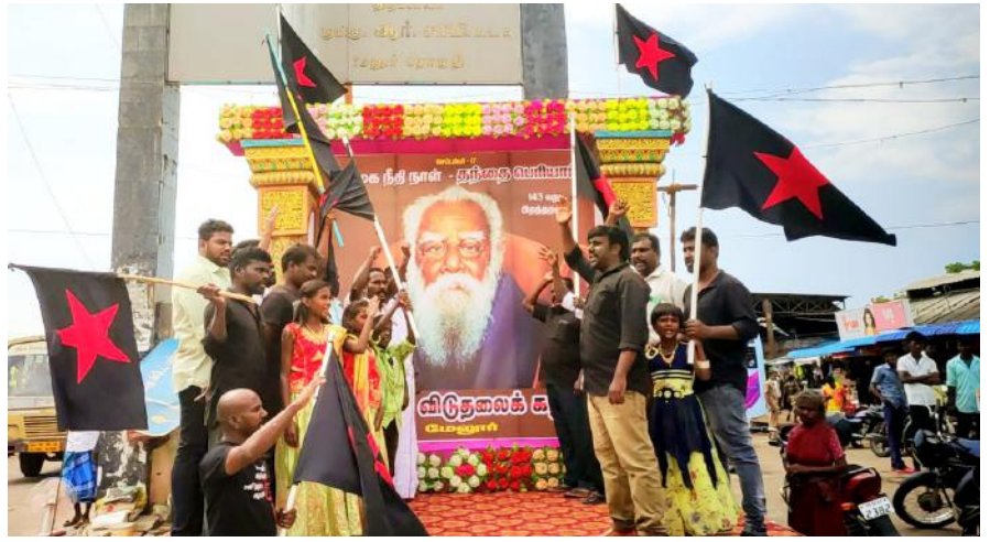
பெரியார் படம் கொண்ட பிரம்மாண்ட மேடை அமைக்கப்பட்டு 17.9.2021 ன்று சமூக நீதி நாள் கொண்டாடப்பட்டது.

மதுரையில் எழுச்சியுடன் கொண்டாடப்பட்ட பெரியார் பிறந்த நாள் மதுரை புறநகர் மாவட்டம் சார்பில் மேலூர் பேருந்து நிலைய நுழைவு வாயிலில்