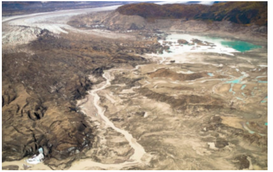
அமெரிக்காவில் உள்ள நாசா வெளியிட்டுள்ள படம்

கேட்கலாம்? இந்த பனிப்பாளங்கள்தான் பல ஆறுகள் உற்பத்தியாவதற்கு மிகப்பெரிய நதிமூலமாக உள்ளன. உதாரணமாக இமயமலையில் உள்ள பனிப்பாளங்கள் கங்கை, சிந்து, பிரம்மபுத்ரா மற்றும் பல வற்றாத ஜீவநதிகள் உற்பத்தியாவதற்கு