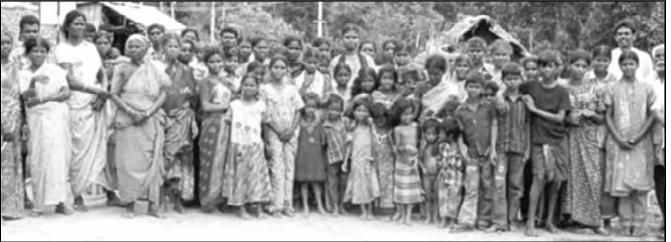
பழங்குடியினரல்லாத மலைவாழ் மக்கள்

மேலும் சுதந்திரம் பெற்ற பின் பழங்குடியினர் வாழும் பகுதிகளில் கனிம வளங்களுக்காகச் சுரங்கங்கள் தோண்டப்பட்டன; பலவகையான தொழிற்சாலைகள் நிறுவப்பட்டன; பெரிய அணைகள் கட்டப்பட்டன; மின் உற்பத்தி நிலையங்கள் அமைக்கப்பட்டன. இவற்றால் பெரும் பரப்பளவில் காடுகள் அழிக்கப்பட்டன. அதனால் பழங்குடியினரும் பிற மலைவாழ் மக்களும் அவர்களின் வாழ்விடங்களிலிருந்து அரசின் காவல்துறையால் பல இலட்சம் பேர் வெளியேற்றப்பட்டனர்.