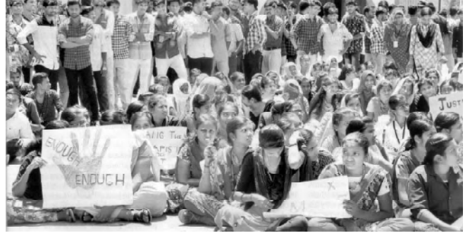
மார்ச்சு 15 அன்று கிருட்டிணகிரி பொறியியல் கல்லூரி மாணவர்கள் ஆர்ப்பாட்டம்

கோவை மாவட்டக் காவல் துறைக் கண்காணிப்பாளர், உச்சநீதிமன்றத்தின் நெறிமுறைகளுக்கு மாறாக, கல்லூரி மாணவியின் பெயரை வெளியிட்டார். இதன்நோக்கம் பாதிக்கப்பட்ட மற்ற பெண்கள் புகார் அளிக்க முன்வரக்கூடாது என்பதே ஆகும். மேலும் புலனாய்வும் விசாரணையும் தொடங்குவதற்கு முன்பே, குற்றம் சாட்டப்பட்ட நால்வருக்கும் அரசியல்வாதிகளுக்கும்