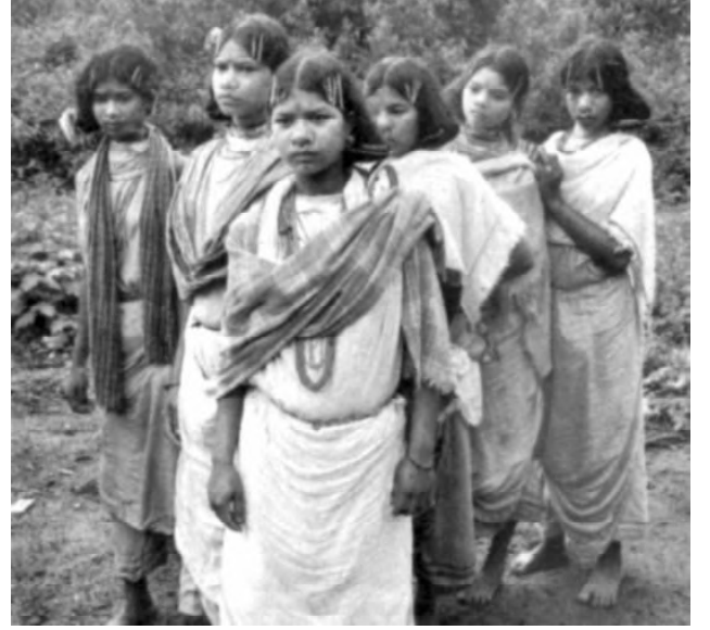
பழங்குடி இனப் பெண்கள்

2006-இன் வன உரிமைச் சட்டம் கிராம சபைகளுக்கு விரிவான அதிகாரங்களை வழங்கி யுள்ளது. அவர்களின் நிலவுரிமைக்கும் காடுகள் மீதான உரி