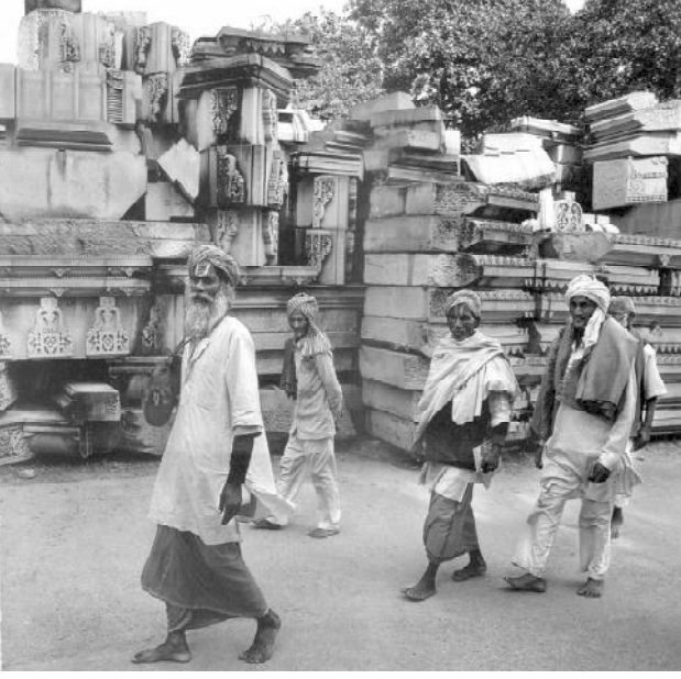
அயோத்தியில் கரசவேபுரத்தில் இராமர் கோயில் கட்டுவதற்காக தயாராக உள்ள கல்தூண்கள்

மாதங்களுக்குள் அதன் பணியை முடிக்க வேண்டும் என்று கூறப்பட்டாலும், மூன்று ஆண்டுகளுக்கு மேலும் கால நீட்டிப்புப் பெறுவதைப் பார்க்கிறோம். ஆனால் உச்சநீதிமன்றம் அமைத்துள்ள சமரசக்குழுவிற்குக் கால நீட்டிப்பு வழங்கப்பட்டாலும், அது மிகவும் குறுகிய காலத்திற்கே இருக்கும் என்று எதிர்பார்க்கப்படுகிறது.