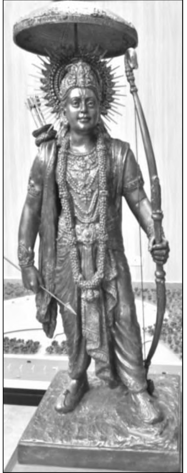
அயோத்தியில் 221 மீட்டர் உயரத்தில் அமைக்கப்பட உள்ள இராமர் சிலையின் தோற்றம்

விசுவ இந்து பரிசத்தின் இந்துத்து வப்பரப்புவையை எதிர்ப்பதற்கு உண்மையான மதச்சார்பின்மையை முன் எனடுத்து முறியடிப்பதற்குப் பதிலாக இளம் பிரதமர் இராசிவ் காந்தி மென்மையான இந்துத்துவப் போக்கைப் பின்பற்றினார். இராசிவ் காந்தியின் அறிவுறுத்தலின்