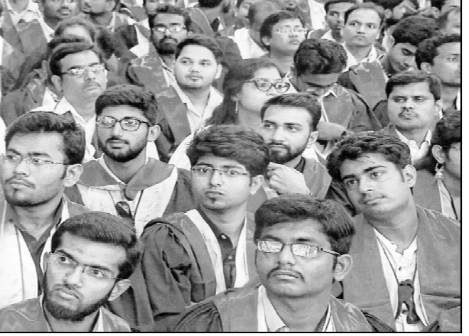
2018 சூலை 20 அன்று சென்னை ஐ.ஐ.டி. பட்டமளிப்பு விழாவில்

மற்ற உயிரினங்களுக்கும் மனிதனுக்கும் உள்ள முதன்மையான வேறுபாடு - மனிதன் மட்டுமே உற்பத்தி செய்கிறான்; கருவிகளைக் கொண்டு, தன் உழைப்பைச் செலுத்தி, இயற்கையில் உள்ள பொருள்களைப் பயன்படுத்தித் தன் தேவைக்கான பொருள்களை உற்பத்தி செய்கிறான். மனிதகுல வரலாற்றில் மனிதனின் அறிவாற்றலால் கருவிகளில் ஏற்பட்ட தொழில் நுட்ப வளர்ச்சி, உற்பத்தித் திறனிலும், உற்பத்தியின் பெருக்கத்திலும் பாய்ச்சலான முன்னேற்றங்களை உண்டாக்கியுள்ளன. இந்த உற்பத்திப் பெருக்கத்தின் பயன்களில் பெரும் பகுதியை நாட்டின் மக்கள் தொகையில் சிறிய விழுக்காட்டினராக உள்ள மேல்தட்டு ஆளும் வர்க்கத்தினரே துய்க்கும் வகையிலான அரசமைப்பும் ஆட்சி முறையும் இருந்து வருகின்றன.