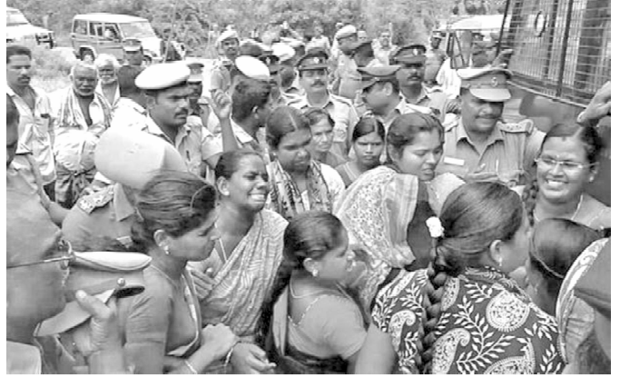
நில அளவீட்டுப் பணிக்கு எதிர்ப்புத் தெரிவித்த பெண்கள் கைது செய்யப்பட்டனர்.

தற்போது சென்னையிலிருந்து சேலம் செல்வதற்கு அய்ந்தாறு மணிநேரமாகிறது. சேலம் அரியானூரிலிருந்து சென்னை வண்டலூர் வரை அமைக்கப்படும் 277 கி.மீ. எட்டுவழிச் சாலையை 2¼ மணிநேரத்தில் பயணம் செய்யலாம் என்று முதலமைச்சர் பழனிச்சாமி 11.6.2018 அன்று சட்டமன்றத்தில் தெரிவித்தார். வண்டலூரிலிருந்து சென்னை நகருக்குள் செல்வதற்கு குறைந்தது 1½ மணிநேரம் தேவைப்படும். மொத்தத்தில் பயண நேரம் இரண்டு மணிநேரம் குறைவதாகவே ஒத்துக் கொள்வோம். இதனால் யாருக்கு நன்மை? மணிக்கு 120 கி.மீ. வேகத்தில் செல்லக்கூடிய மகிழுந்தில்