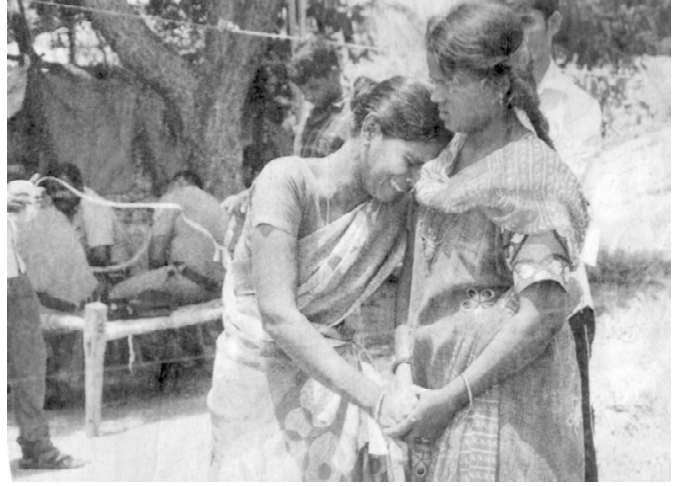
சேலம் பாரப்பாடி பகுதியில் தாங்கள் வசிக்கும் வீடு, நிலத்தை வருவாய் துறையினர் கணக்கெடுத்துக் கொண்டிருக்க, துக்கம் தாளாமல் தன் மகளின் தோளில் சாய்ந்து கதறி அழும் பெண்

சேலம் மாவட்டத்தில் அரியானூர் தொடங்கி தருமபுரி மாவட்டத்தையொட்டியுள்ள மஞ்சவாடி கணவாய்