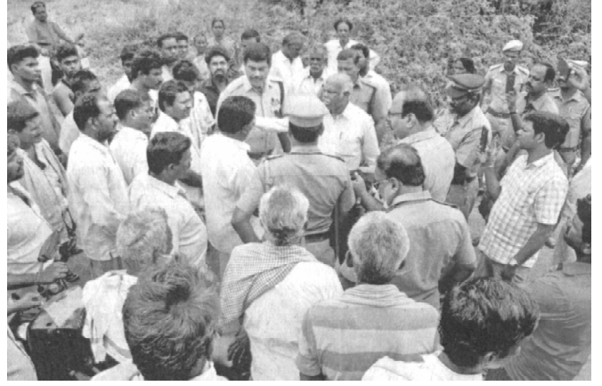
உத்திரமேரூரில் நடைபெற்ற நிலம் அளவீட்டுப் பணியின்போது வாக்குவாதத்தில் ஈடுபட்ட அப்பகுதி மக்கள்

நரேந்திரமோடி 2014 நாடாளுமன்றத் தேர்தலின் போது, ஆட்சிக்கு வந்தால் ஆண்டுக்கு 2 கோடி பேருக்கு வேலை தரப்படும் என்று வாக்குறுதி அளித்தார். இதன்படி இந்த நான்கு ஆண்டுகளில் 8 கோடி வேலை வாய்ப்புகள் உருவாகியிருக்க வேண்டும். ஆனால் இதுவரை 50 இலட்சம் புதிய வேலை வாய்ப்பு கூட உண்டாகவில்லை. மாறாக, பணமதிப்பிழப்பு நடவடிக்கை சரக்கு - சேவை வரி அமலாக்கம் ஆகியவற்றால் கடந்த ஓராண்டில் தமிழகத்தில் மட்டும் 50,000 சிறுகுறு தொழில்கள் அழிந்துபோயின. 5 இலட்சம் பேர் வேலை இழந்துள்ளனர் என்று சட்டமன்றத்திலேயே தெரிவிக்கப்பட்டது. திருப்பூர் போன்ற நகரங்களில் பத்து பேருக்கு