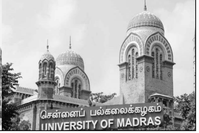
பல்கலைக்கழகங்களின் உயர்கல்வி மீது தமிழ்நாட்டு அரசுக்கு உள்ள உரிமைகளைப் பறிக்கும் இந்திய உயர்கல்வி ஆணையம்

2. Separation of Grant Function: மாநிலங்களில் இயங்கி வரும் உயர்கல்வி நிறுவனங்களுக்கு மானியம் அளிப்பதைக் குறைக்கும் முயற்சியே இதுவாகும். அதிகார வர்க்கம் தில்லியில் நிலவுகிற அரசியல் தட்பவெப்ப நிலைக்கு ஏற்பத் தங்கள் கடசிக்கு ஆதரவளிக்கும் மாநில அரசுகளுக்கும் தங்கள் கடசி ஆளும் மாநில அரசுகளுக்கும் அதிக நிதியை ஒதுக்கி, கல்வியில் ஒரு சமனற்ற நிலையை உருவாக்கிவிடும். சான்றாக தமிழ்நாட்டின் உயர்கல்வித்துறை நிதிப் பற்றாக்குறையால் பெரும் சரிவைச் சந்திக்கும் சூழல் உருவாகும். தற்போது தமிழ்நாட்டில் 69 விழுக்காட்டு இடஒதுக்கீட்டுக் கொள்கையை பின்பற்றுவதால் 128 அரசுக் கலை அறிவியல் கல்லூரிகளிலும் 162 அரசின் உதவிப் பெறுகிற கல்லூரிகளிலும் பிற்படுத்தப்பட்ட மிகவும் பிற்படுத்தப்பட்ட-தாழ்த்தப்பட்ட வகுப்பு மாணவர்கள் குறைந்த கட்டணத்தில் உயர் கல்வியைப் பெற்று வருகிறார்கள். மேலும் 1200க்கும் மேற்பட்ட தனியார் சுயநிதிக் கலை-அறிவியல் கல்லூரிகளும் இயங்கி வருகின்றன. உயர் ஆய்வு மேற்கொள்ளப்படும் 22 பல்கலைக்கழகங்களும் 29 நிகர்நிலைப் பல்கலைக்கழகங்களும் இயங்கி வருகின்றன. அதிக எண்ணிக்கையில் உயர் கல்வியில் மாணவர்கள் பட்டங்கள் பெற்று வருவதால், தமிழ்நாடு இந்திய மாநிலங்களிலேயே உயர்கல்வியில் முதலிடத்தில் உள்ளது.