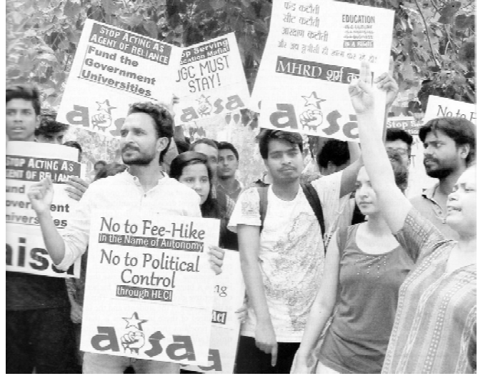
உயர்கல்வி ஆணையச் சட்டத்திற்கு எதிராக 18.7.2018 அன்று தில்லியில் மாணவர்கள் நடத்திய ஆர்ப்பாட்டம்

இந்த வரைவில், “இந்திய அரசால் தேசிய அளவில் முதன்மையானவை என்று அறிவிக்கப்பட்ட கல்வி நிறுவனங்கள் தவிர்த்து, நாடாளுமன்றத்தின் எந்தவொரு சட்டத்தின் கீழும், மாநிலச் சட்டமன்றத்தின்