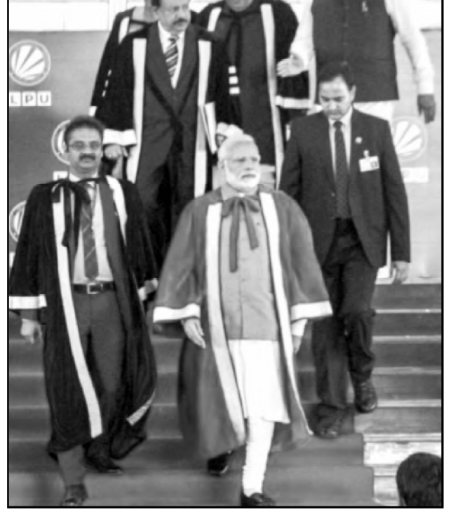
2018 சனவரி 3 அன்று ஜலந்தரில் அறிவியல் மாநாட்டைத் தொடக்கிவைத்த மோடி

மும்பை அறிவியல் மாநாட்டில் “பண்டைய தாவரவியலில் பொறியியல் பயன்பாடு”, “யோகாவில் நரம்பியல் அறிவு”, “இந்திய அறுவை மருத்துவத்தின் வளர்ச்சிகள்” என்கிற தலைப்புகளில் கட்டுரைகள் படிக்கப்பட்டன. இக்கட்டுரைகளின் நோக்கம், இன்று வளர்ச்சி பெற்றுள்ள அறிவியல் அனைத்