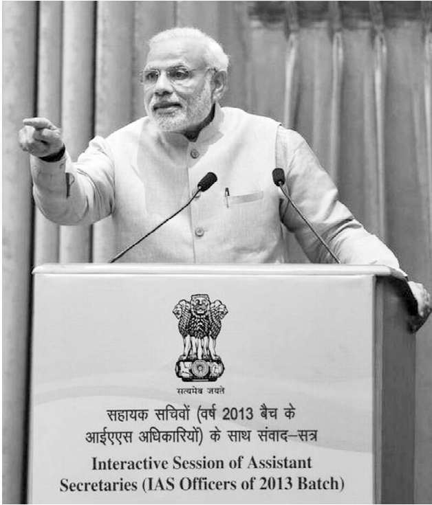
புதியதாகப் பணியில் சேர்ந்த இளம் ஐஏஎஸ் அதிகாரிகளிடம் தில்லியில் பிரதமர் நரேந்திர மோடி உரையாற்றுகிறார்

ஆங்கிலேயரின் ஆட்சியின்கீழ் இந்தியா வருவ தற்குமுன், இந்தியா என்பது ஒரே நாடாக - ஒரே நிர்வாகத்தின்கீழ் வரலாற்றில் ஒருபோதும் இருந்த தில்லை, 1800இல்தான் இப்போது தனிநாடுகளாக உள்ள பாக்கித்தான், வங்கதேசம், ஆப்கானிஸ்தான் ஆகியவற்றை உள்ளடக்கிய இந்தியத் துணைக் கண்டம் ஒரே நாடாக ஆங்கிலேயரின் கட்டுப்பாட்டுக்குள் வந்தது.