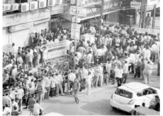
பணமதிப்பிழப்பு அறிவிப்புக்குப்பின் 2016 நவம்பர் 16 அன்று புதுதில்லியில் வங்கிகளின் முன் தங்கள் பணத்தை மாற்றுவதற்காக நீண்ட வரிசையில் நிற்கும் மக்கள்

கடந்த 27 ஆண்டுகளாகக் காங்கிரசும் பாஜகவும் மாறி மாறி ஒன்றிய அரசில் ஆட்சியமைத்தன. ஆனால் பொருளாதாரக் கொள்கைகளில் துளியளவு மாற்றம் கூட ஏற்படவில்லை. எந்த உயரிய நோக்கத்திற்காக ஐந்தாண்டுத் திட்டக் காலங்களில் நேரு பல்வேறு சமூக, பொருளாதாரத் திட்டங்களைக் கட்டமைத்தாரோ அவையெல்லாம் ஒன்றன் பின் ஒன்றாக இக்காலக் கட்டத்தில் சிதைக்கப்பட்டன. அந்நிய முதலீடுகளை ஈர்ப்பதற்காக முழுமையாக நாட்டினுடைய பொருளாதார