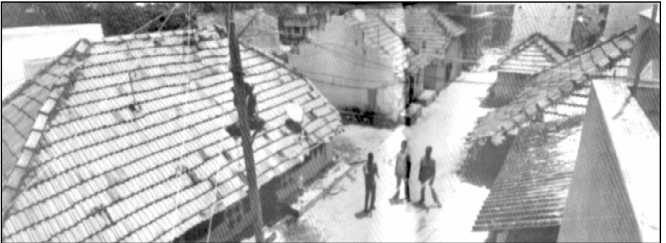
கச்சநத்தம் தாழ்த்தப்பட்டோர் குடியிருப்பு

தமிழ்நாட்டில் தாழ்த்தப்பட்டவர்கள் வாழும் எந்தவொரு “சேரி” யைச் சுற்றிலும் சாதி இந்துக்கள் பெரும் எண்ணிக்கையினராக வாழும் நிலையே இருக்கிறது. இந்துமத சாத்திரங்களின் பெயரால் தாழ்த்தப்பட்டவர்களுக்குக் காலங்காலமாக சமூக உரிமைகளும், உடைமை உரிமையும் மறுக்கப்பட்டு, சாதி இந்துக்களையே சார்ந்து வாழும் நிலைக்குத் தள்ளப்பட்ட