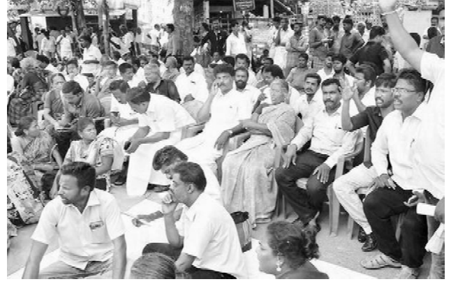
கச்சநத்தத்தில் தலித்துகள் மீது நடத்தப்பட்ட தாக்குதலைக் கண்டித்து மே 30 அன்று மதுரையில் நடைபெற்ற ஆர்ப்பாட்டம்

மே 29, 30, 31 ஆகிய மூன்று நாட்கள் கச்சநத்தம் படுகொலையைக் கண்டித்துத் தாழ்த்தப்பட்டவர்கள் மதுரை மாவட்ட ஆட்சியர் அலுவலகம் முன்பு திருவள்ளூர் சிலை அருகில் ஆர்ப்பாட்டம் செய்தனர். தாக்குதல் நடத்தியவர்களுக்குத் துணையாக இருந்த பழையனூர் காவல் நிலையத் துணை ஆய்வாளரைப் பணியிடை நீக்கம் செய்யாத வரை கொல்லப்பட்டவர்களின் உடல்களைப் பெறமாட்டோம் என்று ஆர்ப்பாட்டக்காரர்கள் கூறினர். இவர்களின் கோரிக்கையின்படி, துணை ஆய்வாளர் பணியிடை நீக்கம் செய்யப்பட்டார். அதேபோன்று பழையனூர் காவல்