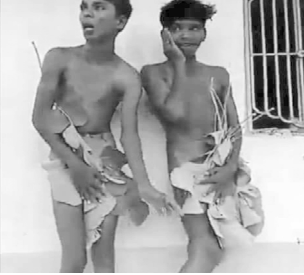
2018 சூன் மாதம் மகாராட்டிராவில் சாதி இந்துவின் கிணற்றில் குளித்ததற்காகத் தாக்கப்பட்ட தலித் சிறுவர்கள்

இந்திய அரசமைப்புச் சட்டத்தில் தீண்டாமையைக் கடைப்பிடிப்பது என்பது தண்டனைக்குரிய குற்றம் என்று எழுதப்பட்டுள்ளது. ஆயினும் தீண்டாமை காரணமாக தாழ்த்தப்பட்டவர்களுக்குப் பலவகையான சமூக உரிமைகள் இன்றளவும் மறுக்கப்பட்டு வருகின்றன. சில மாதங்களுக்குமுன் குசராத்தில் தன் வயலுக்குச் சென்றுவரை தாழ்த்தப்பட்ட ஒருவர் குதிரையைப் பயன்படுத்தினார் என்பதற்காகக் கொல்லப்பட்டார். திருமணத்தின்போது தாழ்த்தப்பட்ட வகுப்பு மணமகன் குதிரைமீது அமர்ந்து வருவதற்குக் கடும்தீர்ப்பு இருக்கிறது. சாதி இந்துக்கள் தெருவில் மிதியடி அணிந்து செல்லக்கூடாது; மிதிவண்டி அல்லது மோட்டர் சைக்கிளில் செல்லக்கூடாது; பிணத்தை எடுத்துச் செல்லக்கூடாது போன்ற பல தடைகள் உள்ளன.