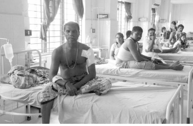
காவல்துறையினரால் கடுமையாகத் தாக்கப்பட்டவர்கள்

காகக் கூட அவர்கள் திரளாக வந்திருக்கலாம் அல்லவா? 144 தடை என்பது எங்கும் எவரும் நான்கு பேருக்கு மேல் கூடக் கூடாது என்று இருந்தால் எப்படி கூட்டம் நடத்துவதற்கு அனுமதி தரப்பட்டது? அங்கு வைத்துச், சுற்றி வளைத்து மக்களைப் போட்டுத் தள்ளவா?