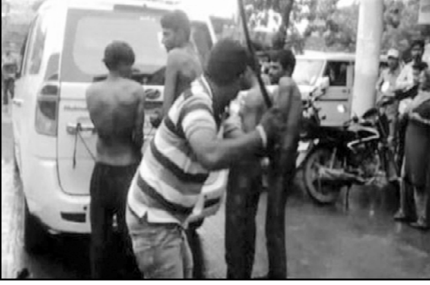
குசராத் உனா நகரில் அரை நிர்வாணம் ஆக்கப்பட்ட தாக்கப்பட்ட நான்கு தலித் இளைஞர்கள்