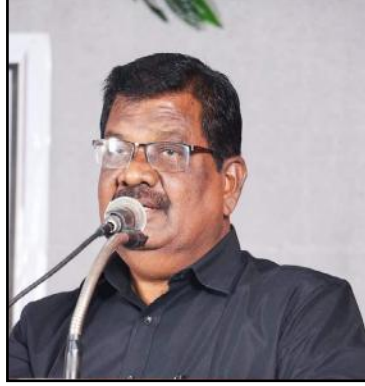
என்பது சிந்திக்க வேண்டியது.