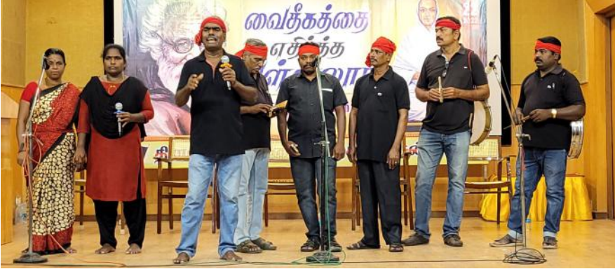
(முதல் பக்கத் தொடர்ச்சி)

கொண்டு வரவில்லை. பிராமணியம் என்பது மன்னர்களால் ஆதரவளிக்கப்பட்டு பிராமண குடியேற்றங்களால் உருவாக்கப்பட்டது. பேராசிரியர் அரசு கூறினாரே பல்லவர் காலத்தில் நிலங்கள் கொடுக்கப்பட்டது என்று. அதற்கு முன்பே துவங்கிவிட்டது. பிரம்மதேயம் என்பது முதலில் கொடுக்கப்பட்டது விந்திய மலைப் பகுதியில். அது அதிக எண்ணிக்கையில் விரிவாக்கம் செய்யப்பட்டது பல்லவர் காலத்தில். அந்த பிரம்மதேயம் பற்றிய குறிப்புகள் இருக்கின்றன. பிரம்மதேயம் எதற்காக கொடுக்கப்பட்டது என்று குறிப்புகள் உள்ளன. இந்தக் குறிப்புகள் முதலில் எழுதப் பட்டது 'பிராகிருத' மொழியில். பின்னர் சமஸ்கிருதத்தைப் பயன்படுத்தினார்கள். பல்லவர்களின் இறுதிக் காலத்தில் தமிழில் வந்தது. பல்லவர்கள் பிராமணர்கள் அல்ல. பல்லவர்கள் உள்ளூர் மக்கள். அவர்களை தங்களது மாய மோசடி வலையில் பார்ப்பனர்கள் வீழ்த்தினார்கள். தென்னகத்தில் சதிரியர்கள் இல்லை என்று அவர்களது புராணம் கூறுகிறது. பிறகு எப்படி பல்லவர்கள் வந்தார்கள்? உள்ளூர் மக்களில் சிலரை விலை பேச முடியும். எப்படிப் பேச முடியும்? "உங்களுக்கு நாங்கள் அந்த தெய்வீக அந்தஸ்தைத் தருகிறோம்". நீங்கள் 'பரத்வாஜ கோத்திரம்' என்று பல்லவ மன்னர்களுக்கு கூறுவார்கள். பரத்வாஜ கோத்திரம் என்பது பிராமண கோத்திரம். அந்த பல்லவ அமைச்சரவையில் அமைச்சர்களாக மாறிய இந்தப் புரோகித கும்பல் தனது கோத்திரத்தை அந்த மன்னனுக்கு கொடுத்து விட்டன. மன்னன் உடன் பிறந்தவன் குத்திரன்; மன்னன் மட்டும் சதிரியன். எந்தவொரு பல்லவ கல்வெட்டிலும் மன்னனை பிராமணன் என்று குறிப்பிடவில்லை. ஆனால் கோத்திரம் பரத்வாஜ கோத்திரம் என்று குறிப்பிடப்பட்டிருக்கிறது. இது இந்தியாவில் எங்கும் காணப்படுகின்ற பிராமணிய விரிவாக்கத்தின் ஒரு வெளிப்பாடு.