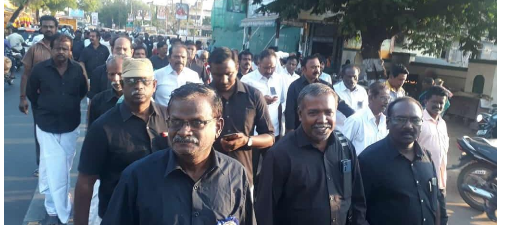
தஞ்சாவூரில் நினைவுப் பேரணி