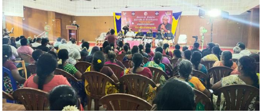
நூல் அறிமுக அரங்கம்.