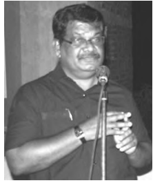
யாரெல்லாம் புறஞ்சேரியில் தங்கி இருந்தார்கள் என சிலப்பதிகாரத்தில் சொல்லப்பட்டிருக்கிறது. பாட்டு பாடும் பார்ப்பனர்கள் எல்லாம் ஜாதியில் இருந்து தள்ளி வைக்கப்பட்டனர்.

"மனு முதலிய நூலோர் விதித்தன செய்தலும் விளக்கென ஒலிதலுமாம் விலக்கியென" மனு சொன்னதை செய்வது அறம், மனு வேண்டாமென சொன்னதை செய்யாமலிருப்பதும் தான் அறம் என்று சொன்னார் பரிமேலழகர். அப்படியென்றால் 4 ஜாதிகளையும் ஏற்றுக்கொண்டதாகத்தான் குறள் இருக்கமுடியும். ஆனால் வள்ளுவர் அப்படி எழுதவில்லை. அதேபோல ஒழுக்கம் என்றால் என்ன? "பார்ப்பனர் முதலான வர்ணத்தார் தமக்கு விதிக்கப்பட்ட கடமைகளையும், ஆசிரமங்களையும் முறையாகப் பின்பற்றுவதுதான் ஒழுக்கம்" என்று பரிமேலழகர் எழுதுகிறார். அந்தந்த வருணத்தார் அவரவருக்கு உரிய கருமங்களை செய்ய