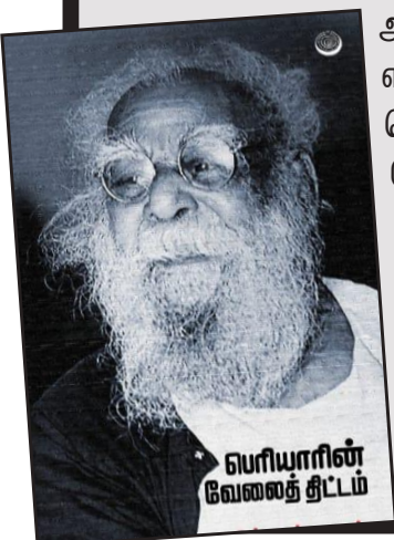
பெரியாரின் வேலைத் திட்டம்

'வெங்காயம்' வெளியீடான இந்நூல் பெற 96009 84294 / 96002 94284 என்ற எண்ணிற்கு தொடர்பு கொள்ளவும்